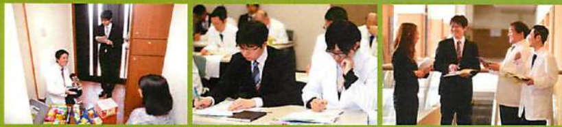
お昼は同行 朝は知識の勉強会 ひとりの研修生に対して3人のアドバイザーが付いて楽しく優しくフォローします! ●約2週間~1ヶ月ごとの面談で不安や悩みを解消できます。身につくまで丁寧に教えますので安心してください。 ●研修期間終了後も、先輩たちと一緒に月1~2回の研修を受講できますので、医薬品などの知識を早く習得できます。 ●また入社1~2年目に特別講師を招いて、資格取得研修も行います。すべて会社でテキストや研修。受講料、試験料などもバックアップいたします。